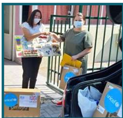
ДНЕВЕН ЦЕНТАР ЗА ЛИЦА СО ИНТЕЛЕКТУАЛНА И ТЕЛЕСНА ПОПРЕЧЕНОСТ ВО РАЗВОЈОТ – КАВАДАРЦИ