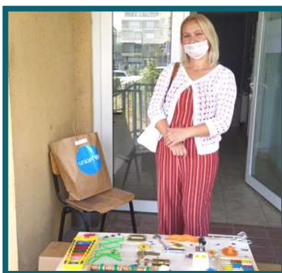
ДНЕВЕН ЦЕНТАР ЗА ЛИЦА СО ТЕЛЕСНА ИЛИ ИНТЕЛЕКТУАЛНА ПОПРЕЧЕНОСТ – ГОСТИВАР