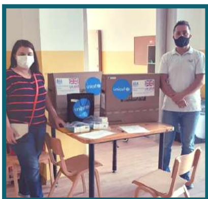
ДНЕВЕН ЦЕНТАР ЗА ЛИЦА СО ЦЕРЕБРАЛНА ПАРАЛИЗА СКОПЈЕ

Здружението за асистивна технологија Отворете ги прозорците во склоп на проектот „Пилотирање на модел за трансформација на дневни центри“, поддржан од УНИЦЕФ, Британската Амбасада и МТСП, во јули оваа година опреми пет училишта со современа асистивна технологија.