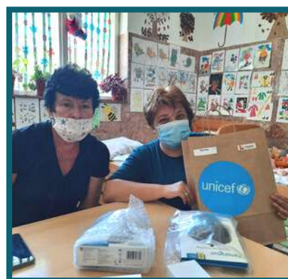
ДНЕВЕН ЦЕНТАР ЗА ЛИЦА СО ИНТЕЛЕКТУАЛНА И ТЕЛЕСНА ПОПРЕЧЕНОСТ ВО РАЗВОЈОТ – КРАТОВО

Опремата вклучувашет екрани на допир, асистивни тастатури, тракболи, џоистици, издвоени кликови, смарт сензорни табли, ламинатори за пластифицирање и продукција на картички за комуникација и асистиви помагала за правилно држење на молив.