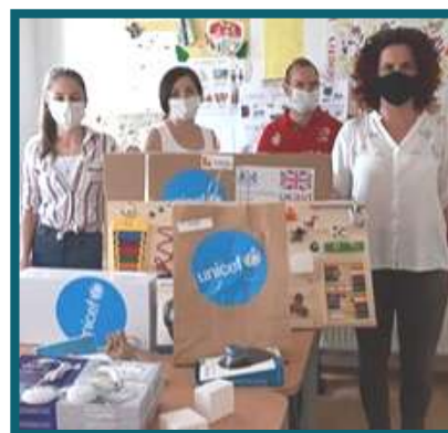
ДНЕВЕН ЦЕНТАР ЗА ЛИЦА СО ЦЕРЕБРАЛНА ПАРАЛИЗА- ПРИЛЕП