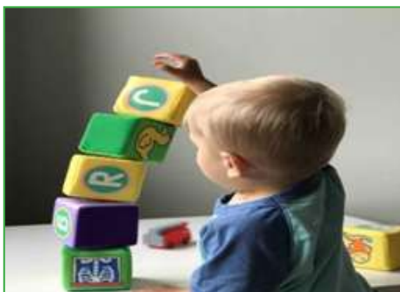
Слика 4. Дел од активностите на дете од 18 до 24 месеци

Дозволете децата да имаат самостојна игра и игра со друго дете. Играта да биде резултат од нивната бујна фантазија, која е побујна и од фантазијата на возрасните. Бидете во нивна близина и секои неправилности кои ќе ги забележите во текот на играта коригирајте ги. Играта е развој, развојот е игра.