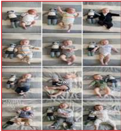
Слика 1. Интерминентност во развој