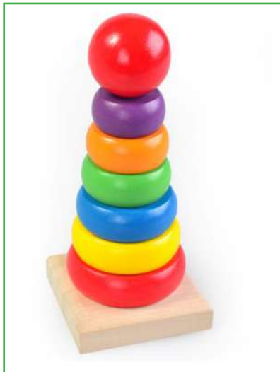
Слика 5. Едукативен сет за активности за деца на 3 и 4 години