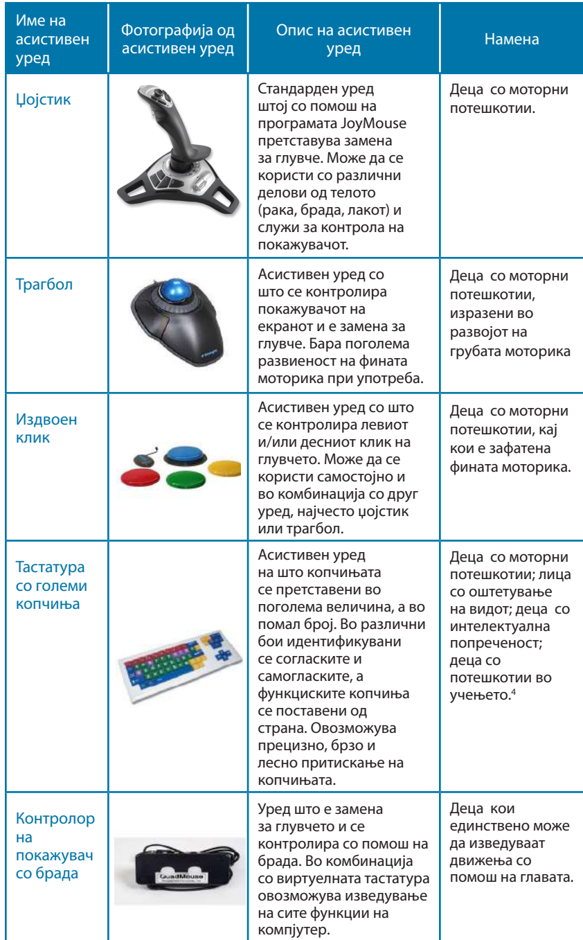
Табела 2: Асистивни информатички уреди