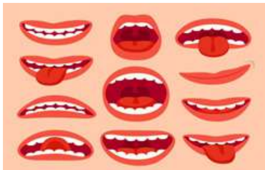
Слика 6 и 7. Вежби за говорен апарат

Логопед е стручно лице кое што работи во делот на превенција, проценка, дијагностицирање и третман во областа на јазично – говорната патологија, односно потешкотии во комуникацијата кај децата и возрасните. Најчесто поставувано прашање од младите родители е „Кога на логопед“. Родителите се најголем фактор за развојот на говорот на своето дете, но и фактор за решавање на говорните потешкотии. Тие се неговите модели за правилен говор и детето уште од најрана возраст говорот го учи од своите родители. Доаѓањето на логопед никогаш не е прерано, родителот после првата година може консултативно да се информира за развојот на говорот и јазикот кај неговото дете. Доколку детето до 2-та година не прозбори тогаш е вистинско време за совет и стручна помош. Првите знаци кои може да покажат на некои неправилности се кога детето не реагира на своето име, а ова се забележува околу 9-от месец после гугањето како фаза, доколку детето со поглед не покажува на поставено прашање каде е мама, на 12 месеци сеуште со рака не прави чао, на 18 месеци ако има само гест, а нема ни еден збор. Да не заборавиме дека навремена детекција знаци и навремена корекција.