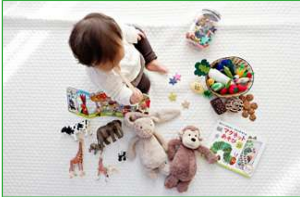
Слика 3. Дел од едукативните сетови во првата година

Важно е секој родител да разбере како треба да изгледа развојот на говорот и јазичните вештини кај неговото дете, а истото е прикажано на табелата подолу.